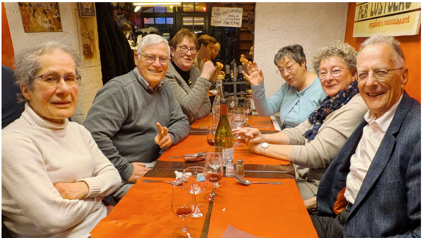
Diner au restaurant Chez Lazare à Versailles la veille du départ