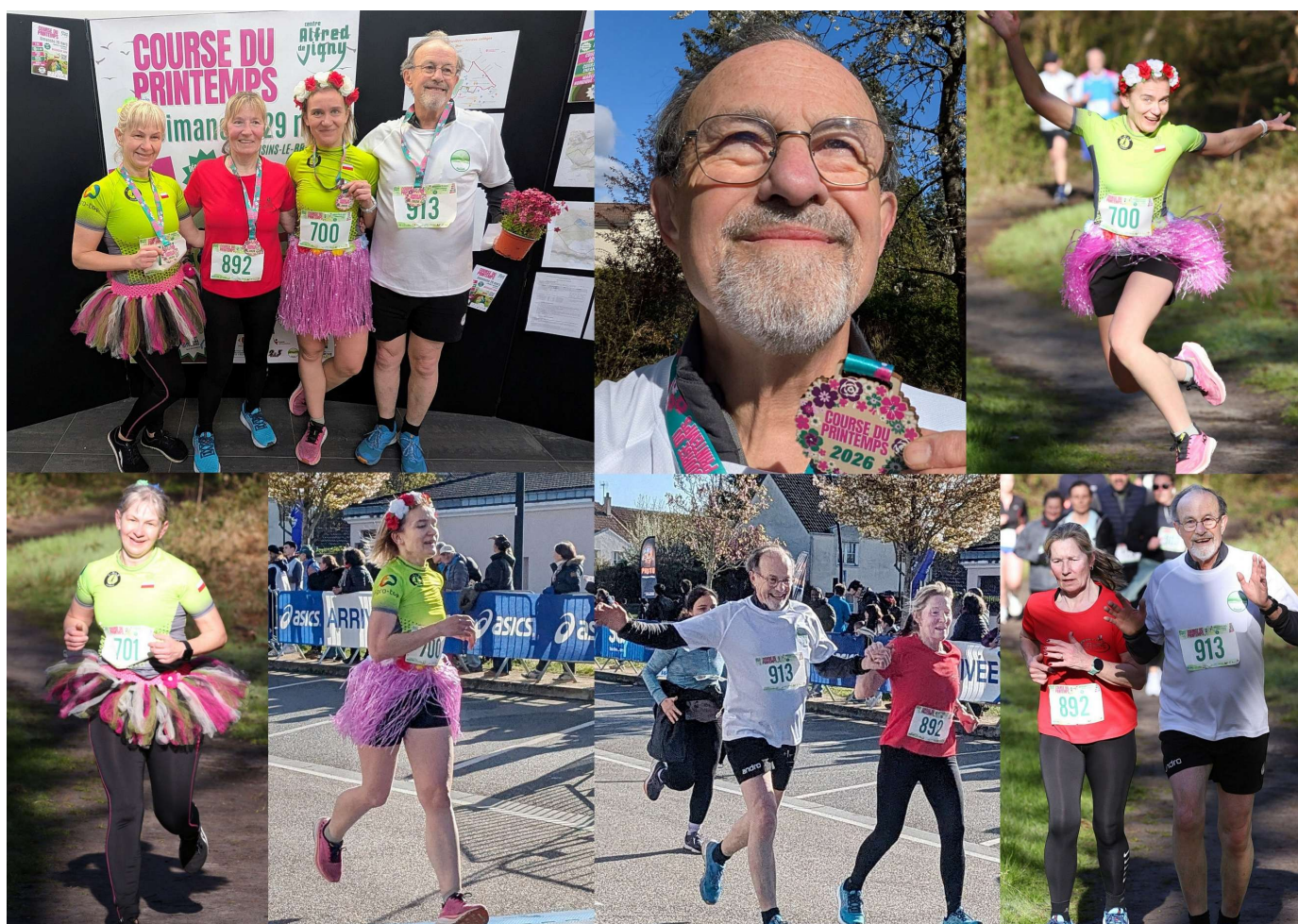
Photos de la course (La grande Vicinoise 6 km) ; le thème était les fleurs.