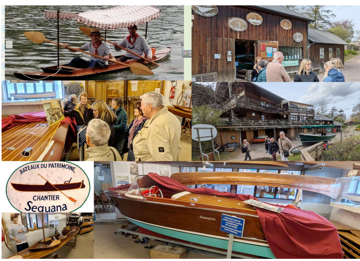
Visite guidée de l'atelier de l'association SEQUANA de restauration et de construction à l'identique de bateaux d'époque du 19 ème et 20 ème siècles (canoës, canots, yoles, voiliers, etc.).