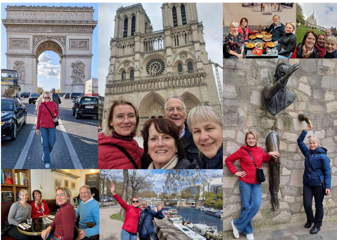
Visite de Paris : Montmartre, Notre Dame, Arc de Triomphe, Canal St Martin, etc.

Au-delà de l'effort sportif, ces quatre jours ont été rythmés par de riches découvertes culturelles . Paris s'est offert à elles sous ses plus beaux visages : Notre-Dame et la Butte Montmartre, la Place des Vosges, le Jardin des Plantes et la Grande Mosquée, l'Arc de Triomphe et une escapade royale au château de Fontainebleau .